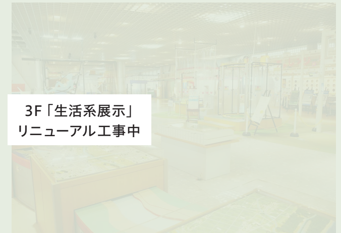
3F「生活系展示」 リニューアル工事中