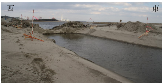
Fig.4 新たな通水部分の建設工事のようす