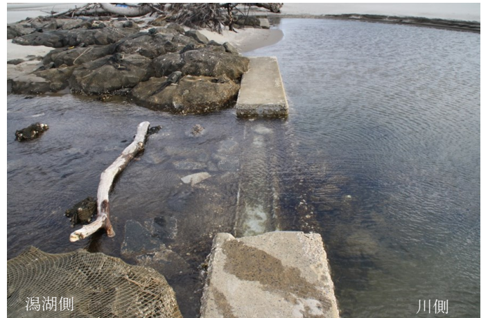
Fig.3 通水部分の水の出入り 西側より撮影