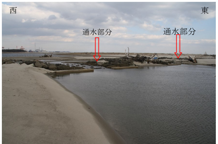
Fig.2 導流堤の通水部分 南側より撮影