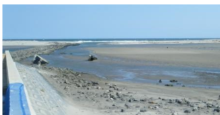
Fig.2 イシガレイ採集地点①