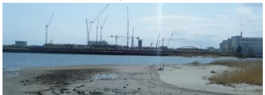
Fig.3 イシガレイ採集地点②