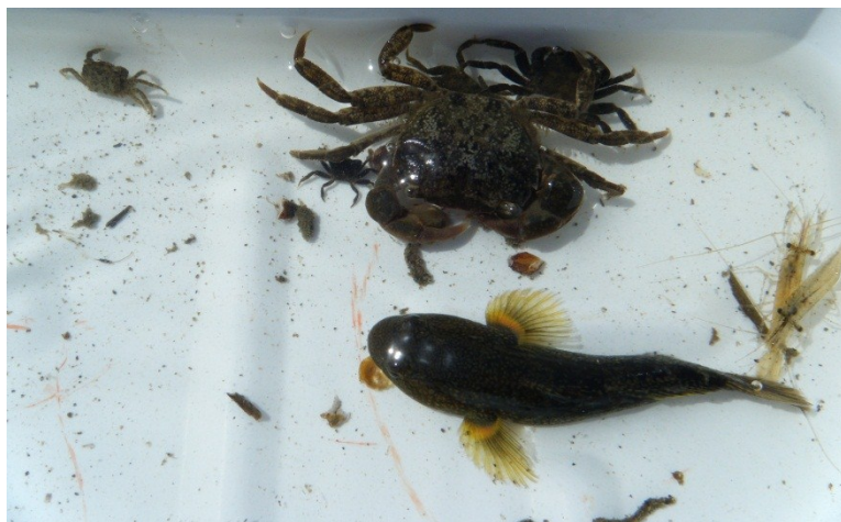
Fig.3 越冬中のチチブ、ケフサイソガニ、ユビナガスジエビ