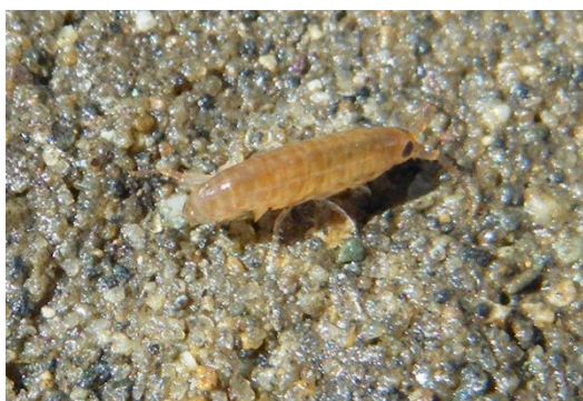
Fig.1 石の下にいたヨコエビ

陽射しは日一日と強くなっているが、水温は最も低い時期である。生物たちは目前に迫った春を待っていることであろう。石の下にはたくさんのヨコエビが越冬しており、陽射しを受けて跳ね回る姿が見られた。