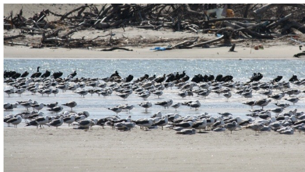
Fig.4 七北田川河口のウミネコやユリカモメ