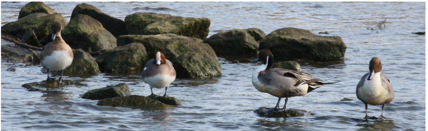
Fig.5 ヒドリガモ(左2羽) オナガガモ(右2羽)