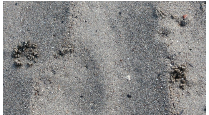
Fig.2 コメツキガニの巣穴