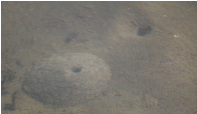
Fig.1 水面下の多毛類の巣穴

2月8,9日に降った雪も溶け、蒲生干潟に入ることができた。冬鳥の姿も少なく干潟はひっそりとしていた。しかし、足下には生物の活動の痕跡が認められ水面下で春の訪れを待っていると思われる。