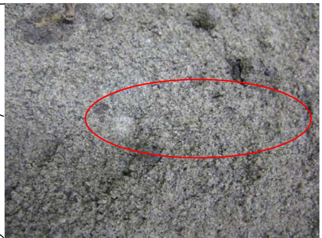
Fig.4 はぎ取り標本に表れたラミナ (葉理)