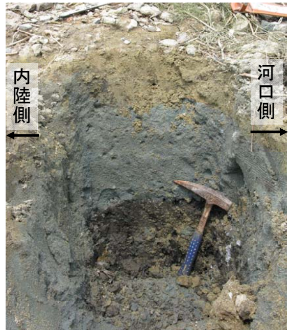
Fig.2 標本を採集した地層のようす