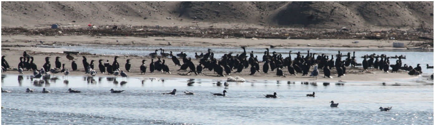
Fig.1 ウの群れ 七北田川河口

魚類やカニなど多くの生物は冬越しに入っているが、冬鳥が蒲生に飛来している。干潟内よりも七北田川河口に多く集まっている。また、サギ類は蒲生干潟の北側に多く見られた。昨年よりは多くの冬鳥が集まっていると思われる。