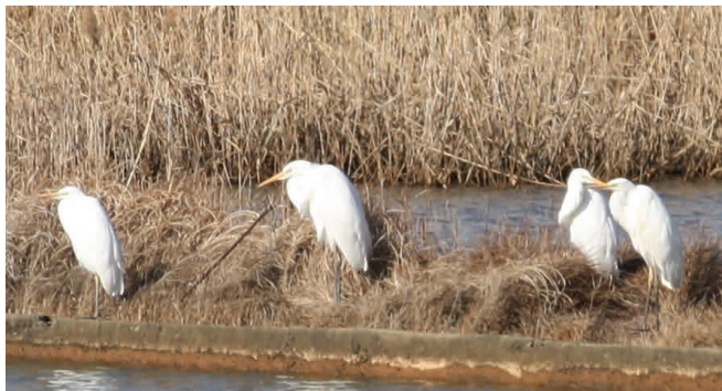
Fig.2 ダイサギ 蒲生干潟北側に隣接する池