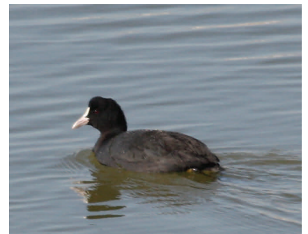
Fig.6 オオバン 蒲生干潟北側に隣接する池