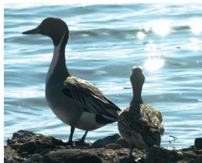
Fig.5 オナガガモ 七北田川岸