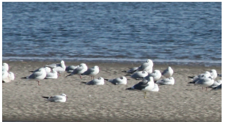
Fig.3 ユリカモメとウミネコ 蒲生干潟北側