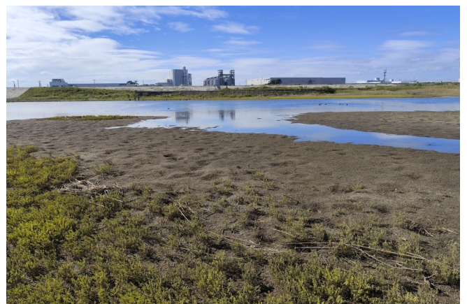
Fig.3 南東潟湖の接続の様子

調査日時：2024年10月1日（火）13:00~14:30（満潮 15:17 潮位 142cm），天気：晴れ