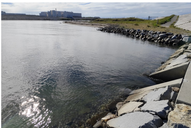
Fig.2 河口から水が流入する様子