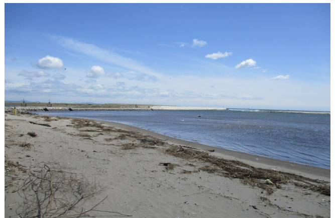
Fig.3 河口から見た導流堤付近の海水流入の様子

調査日時：2024年4月19日（金）10:00~11:30（満潮 12:56 潮位 104cm），天気：はれ