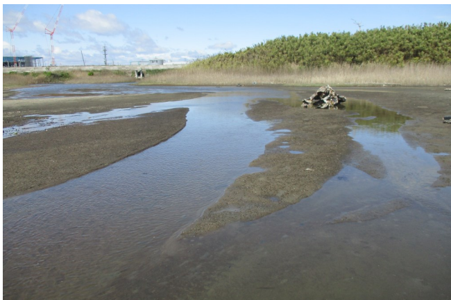
Fig.2 南側潟湖と北側潟湖の接続部分付近