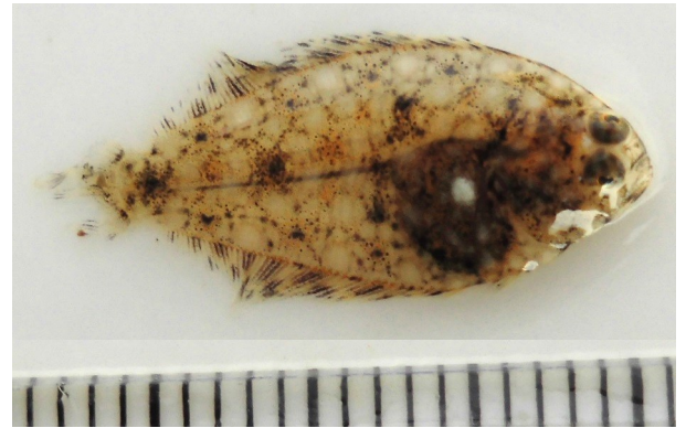
(Fig.3 水門付近で採集した稚魚)