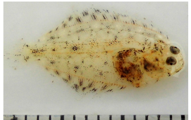
(Fig.4 河口で採集した稚魚)