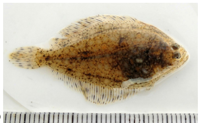
(Fig.5 潟湖内で採集した稚魚)