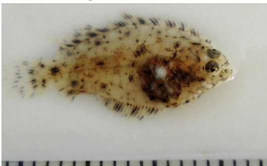
(Fig.2 河口で採集した稚魚)