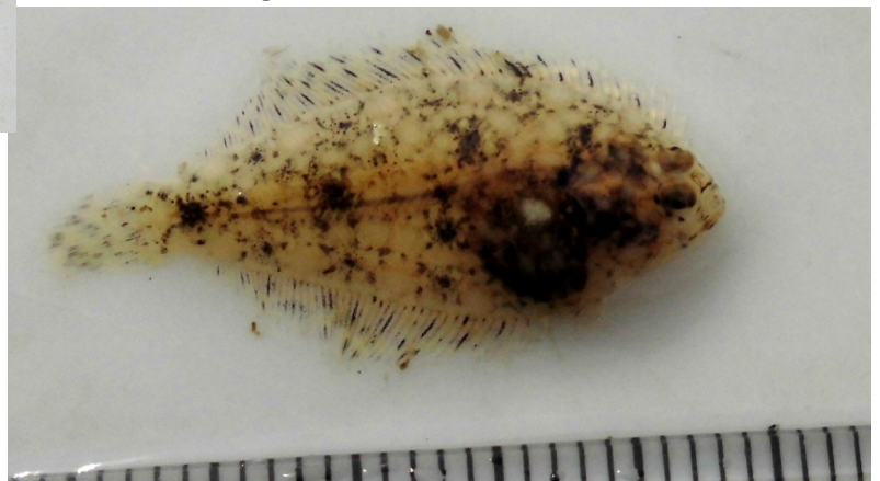
(Fig.4 水門付近で採集した稚魚)