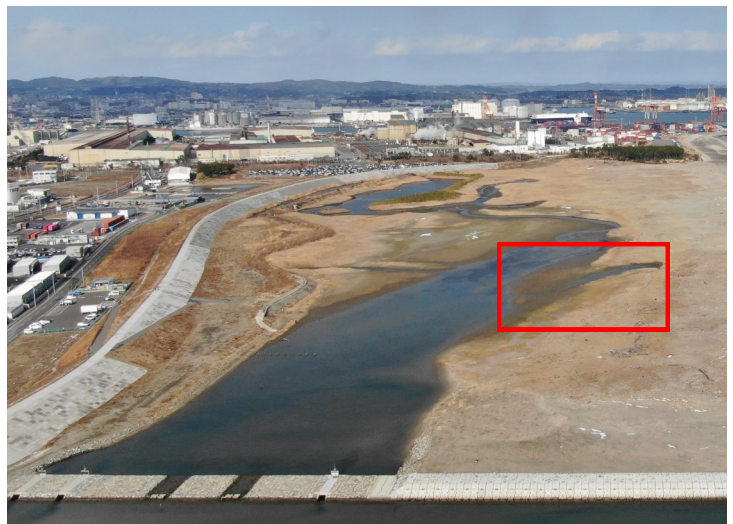
Fig.4 潟湖南側の様子（南側からドローン撮影）

調査日 2023年1月31日（火）13:30～15:00 ※満潮時刻9:34（潮位130cm）