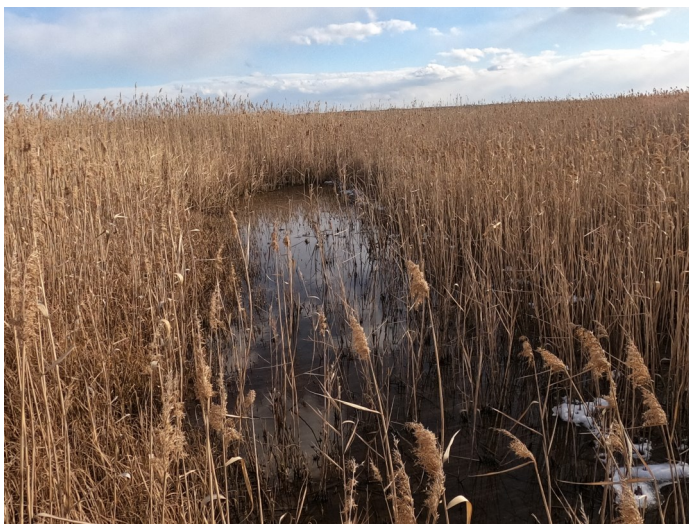
Fig.3 潟湖最北部の様子（北西側から撮影）