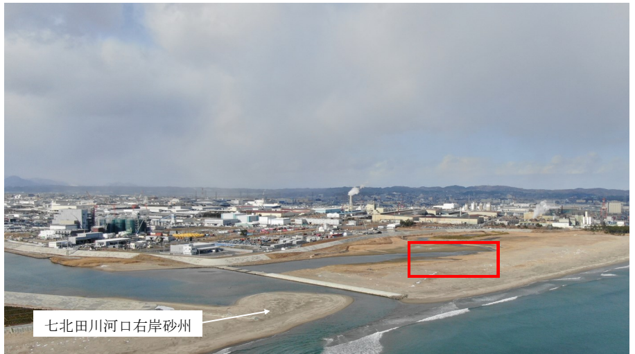
Fig.2 潟湖北側の様子（南側からドローン撮影）