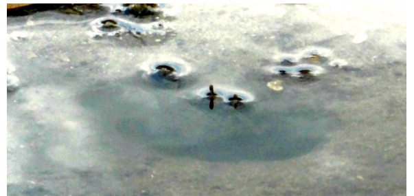
(Fig.3 水中から目だけ出すヤマトオサガニ)