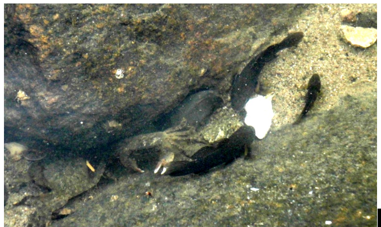
(Fig.4・5 餌に集まったケフサイソガニ、ハゼの仲間 )