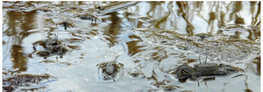
(Fig.2 水辺で活動するヤマトオサガニ)