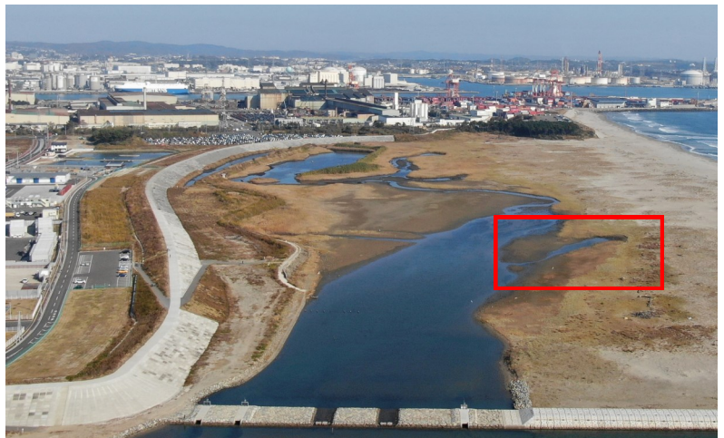
Fig.4 潟湖南側の様子（南側からドローン撮影）

調査日 2022年11月11日（木）9:40～11:00 ※干潮時刻10:38（潮位97cm）