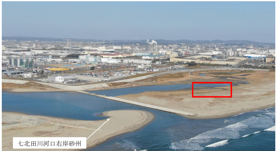
Fig.2 潟湖全体の様子（南東側からドローン撮影）