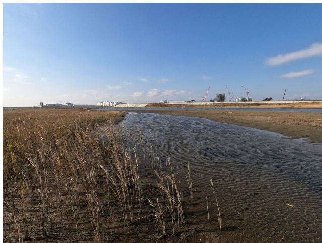
Fig.3 潟湖最北部のヨシ繁茂（南東側から撮影）