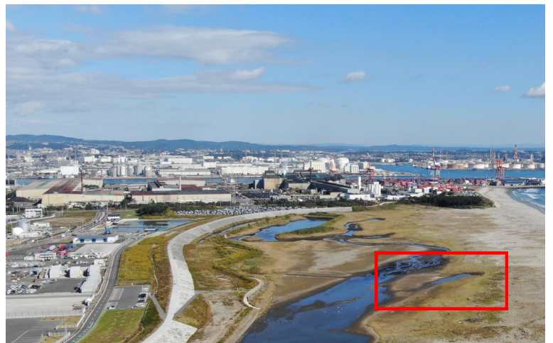
Fig.4 潟湖南側の様子（南側からドローン撮影）

調査日 2022年10月20日（木）9:40～11:00 ※干潮時刻5:54（潮位54cm）