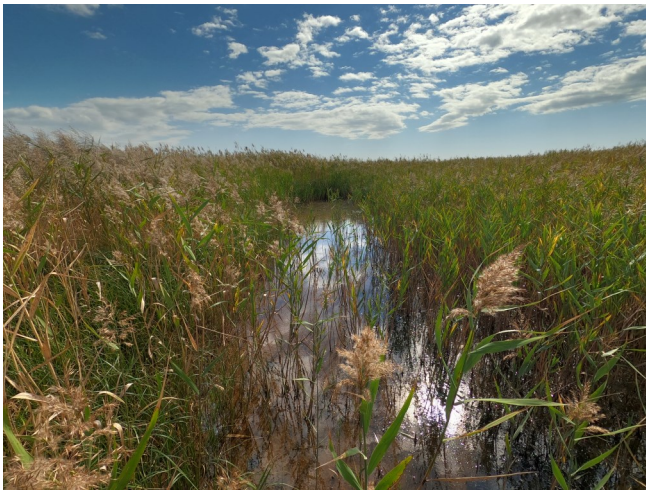
Fig.3 潟湖最北部のヨシ繁茂（南東側から撮影）