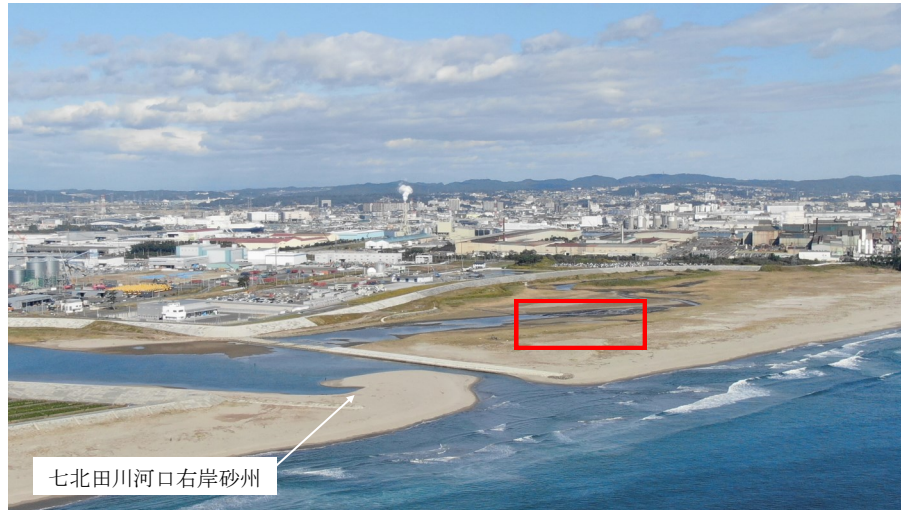
Fig.2 潟湖全体の様子（南東側からドローン撮影）