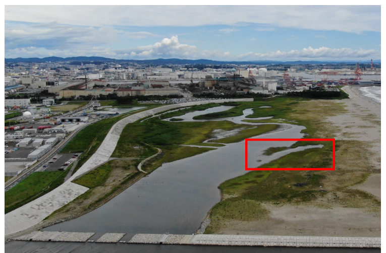
Fig.4 潟湖南側の様子（南側からドローン撮影）

調査日 2022年7月20日（水）9:50～11:20 ※満潮時刻7:47（潮位125cm）