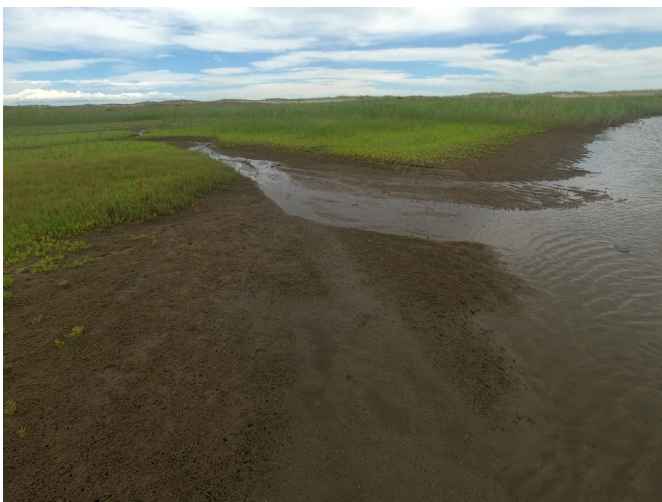
Fig.3 水たまりの流出箇所（西側から撮影）