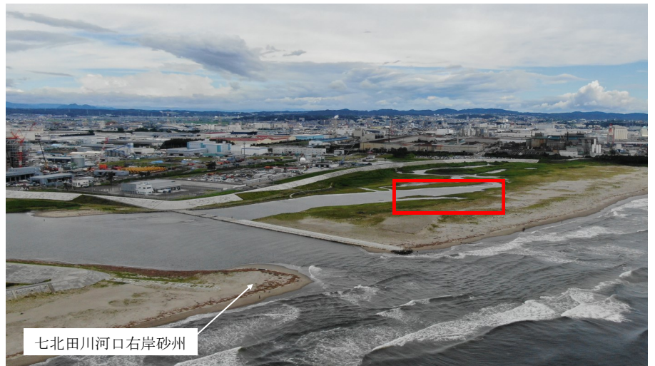
Fig.2 潟湖全体の様子（南東側からドローン撮影）