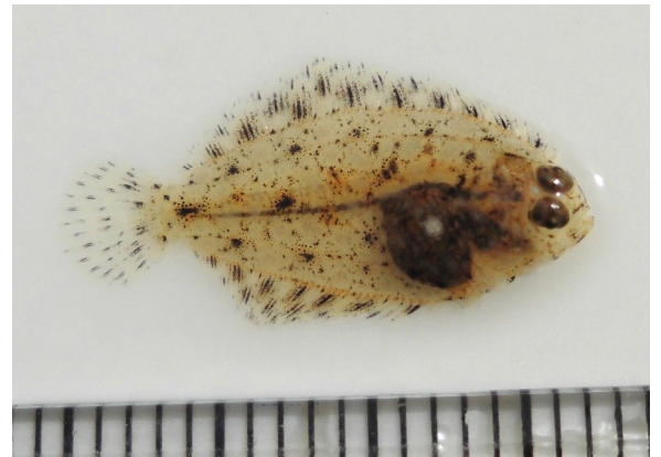
(Fig.2 水門付近で採集したイシガレイ)