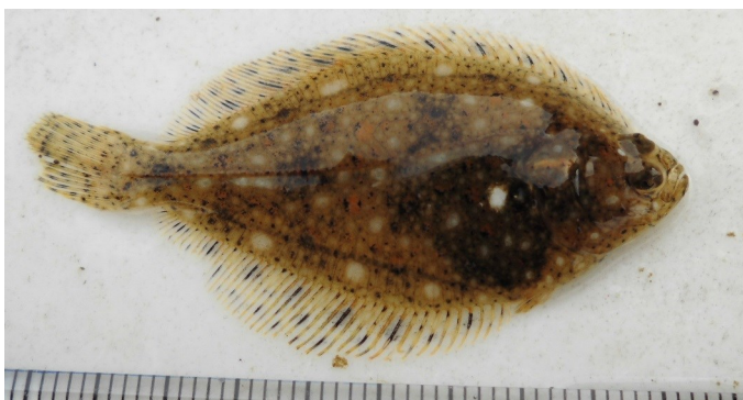
(Fig.3 潟湖内で採集したイシガレイ 最大の個体)