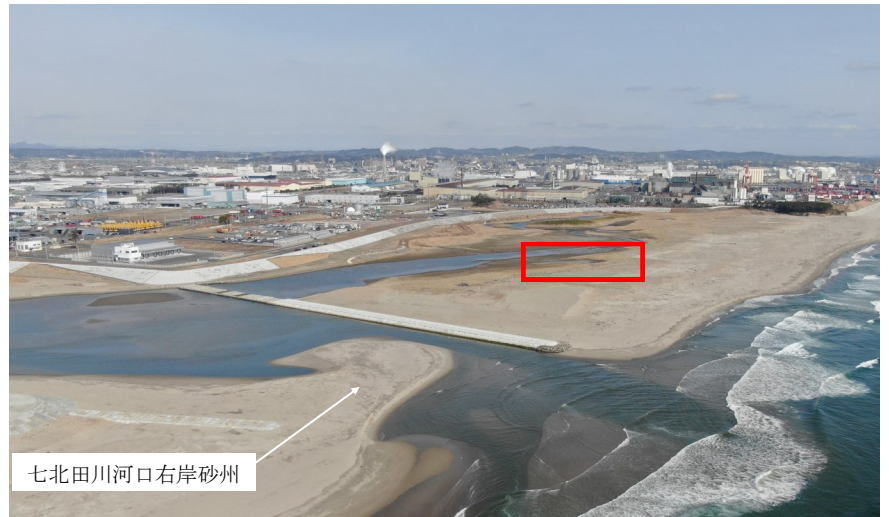
Fig.2 潟湖全体の様子 (南東側からドローン撮影)