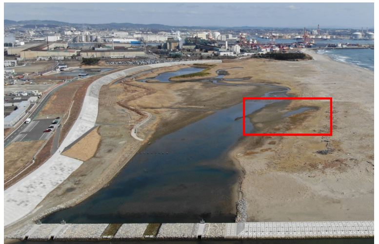
Fig.4 潟湖南側の様子 (南側からドローン撮影)

調査日 2022年3月16日 (水) 9:40～11:10 ※干潮時刻9:04 (潮位76cm)