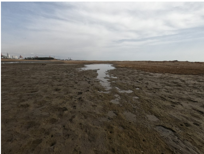
Fig.3 南東側潟湖の分断した様子 (南西側から撮影)