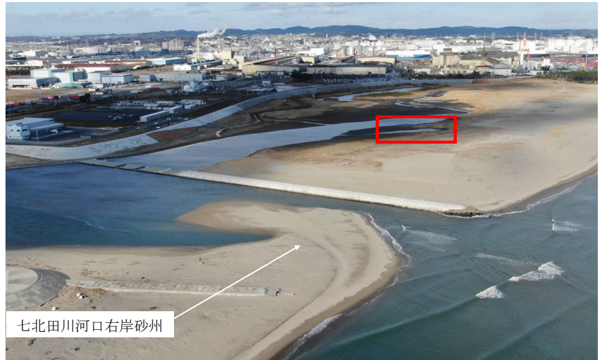
Fig.2 潟湖全体の様子（南東側からドローン撮影）