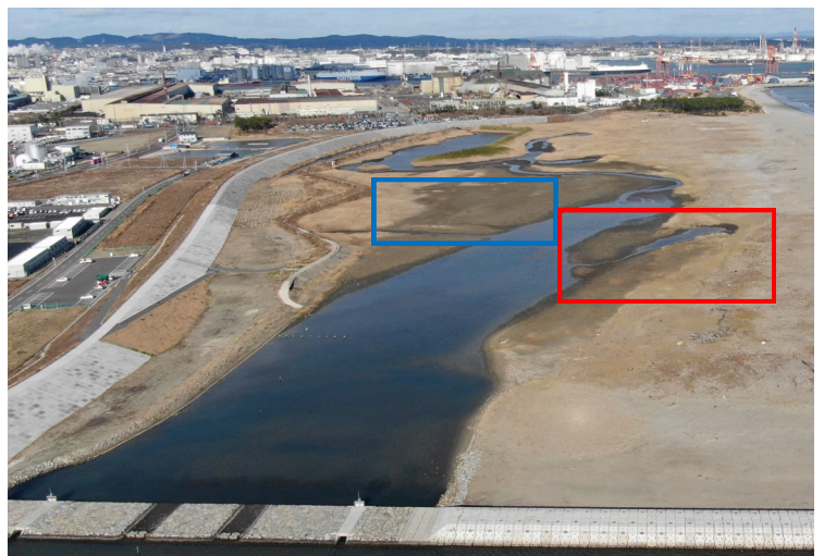
Fig.4 潟湖南西側の様子（南西側からドローン撮影）

調査日 2021年12月22日（水）13:00～14:30 ※干潮時刻11:11（潮位95cm）