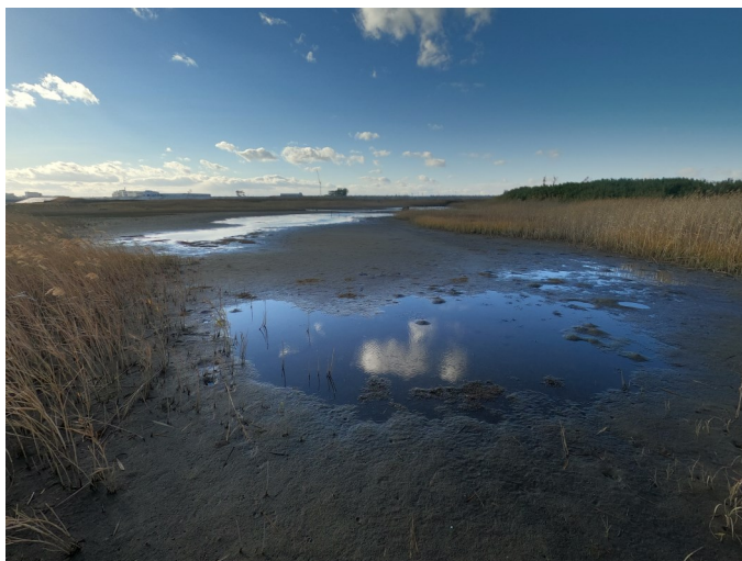
Fig.3 潟湖中央部東側の様子（西側から撮影）