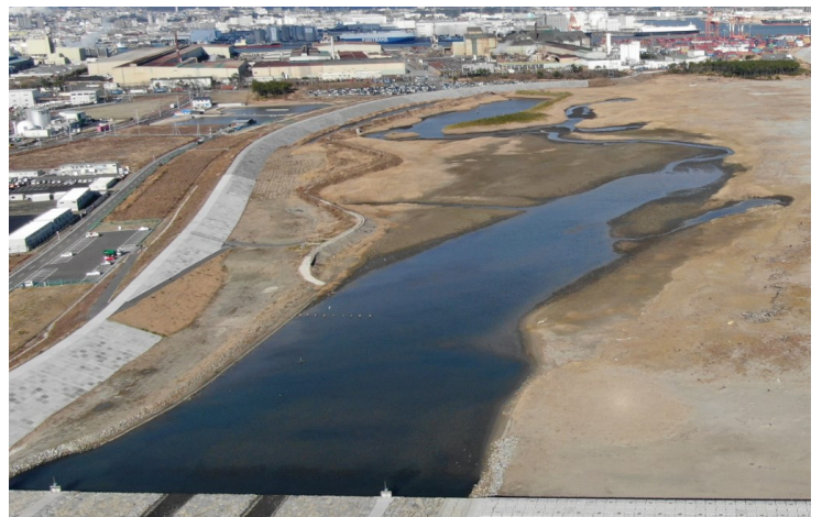
Fig.3 潟湖南部の様子(ドローンによる撮影)

調査日時：2021年12月22日（水）13:00~14:15, 天気:晴れ, 干潮時刻11:11（潮位95cm）