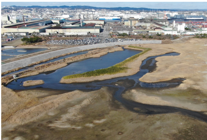
Fig.2 潟湖北部の様子(ドローンによる撮影)