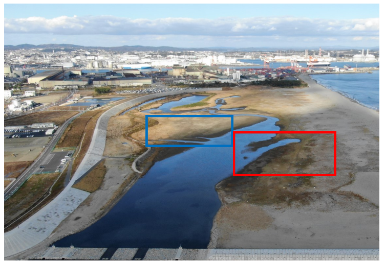
Fig.4 潟湖南西側の様子（南西側からドローン撮影）

調査日 2021年11月17日（水）13:30～15:00 ※満潮時刻14:09（潮位144cm）