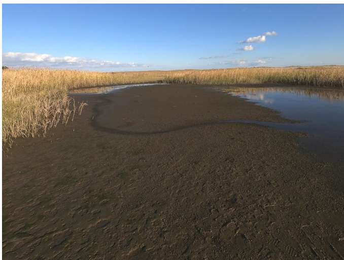
Fig.3 潟湖中央部東側の様子（西側から撮影）