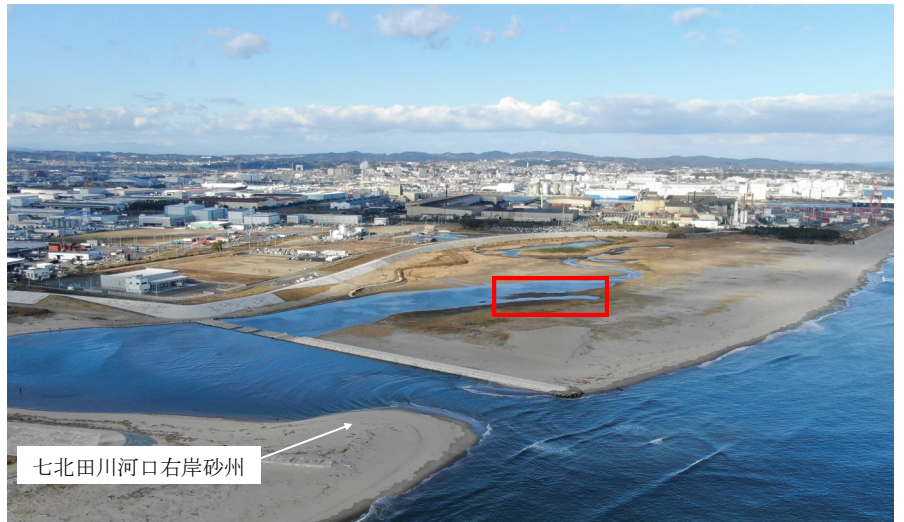
Fig.2 潟湖全体の様子（南東側からドローン撮影）