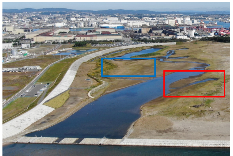
Fig.4 潟湖南西側の様子（南西側からドローン撮影）

調査日 2021年10月14日（木）9:30～11:00 ※干潮時刻3:38（潮位44cm）