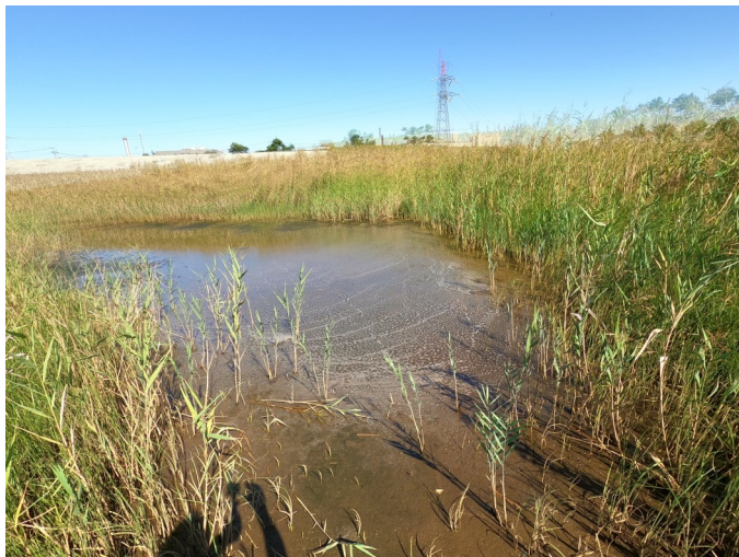
Fig.3 潟湖中央部東側の様子（西側から撮影）