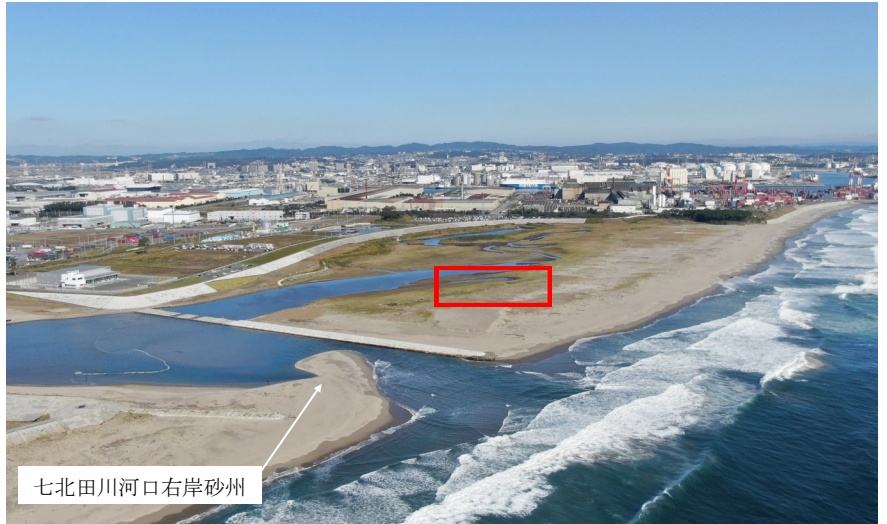
Fig.2 潟湖全体の様子（南東側からドローン撮影）