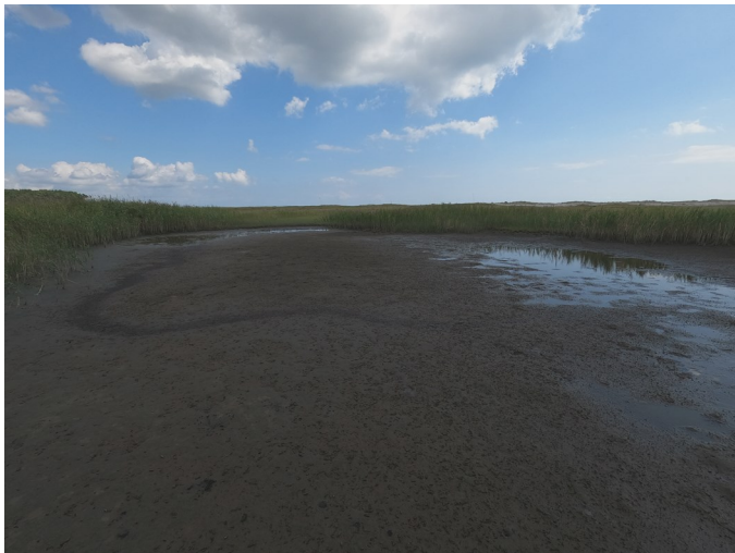
Fig.3 潟湖中央部東側の様子（西側から撮影）