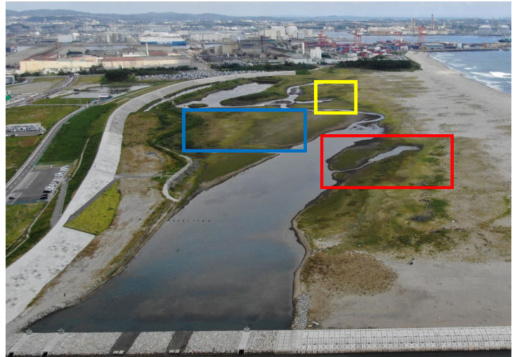
Fig.4 潟湖南西側の様子（南西側からドローン撮影）

調査日 2021年9月15日（水）9:50～11:30 ※干潮時刻4:03（潮位43cm）