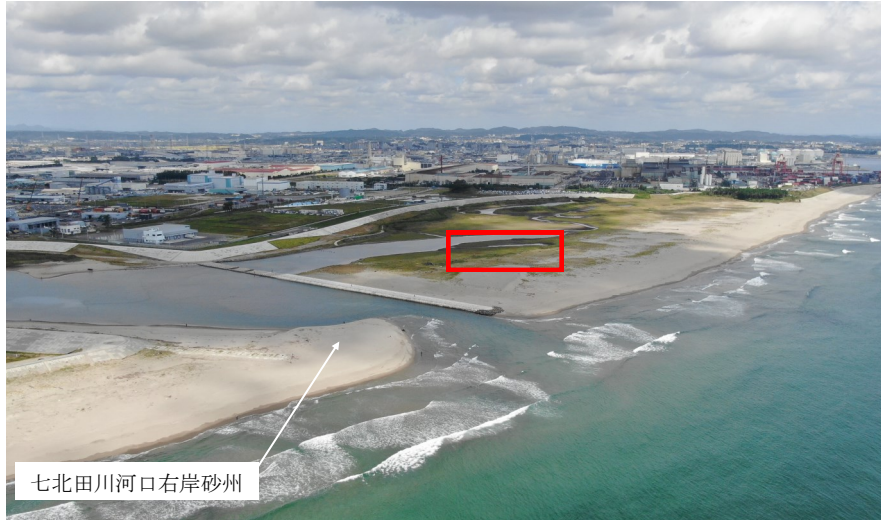
Fig.2 潟湖全体の様子（南東側からドローン撮影）