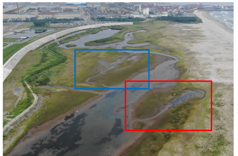
Fig.4 潟湖南西側の様子 (南西側からドローン撮影)

調査日 2021年8月24日 (火) 9:30~11:00 ※干潮時刻10:52 (潮位28cm)