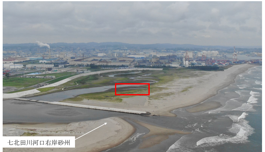
Fig.2 潟湖全体の様子 (南東側からドローン撮影)