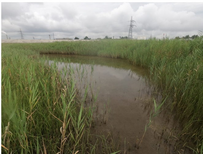
Fig.3 潟湖最北部の様子 (南側から撮影)