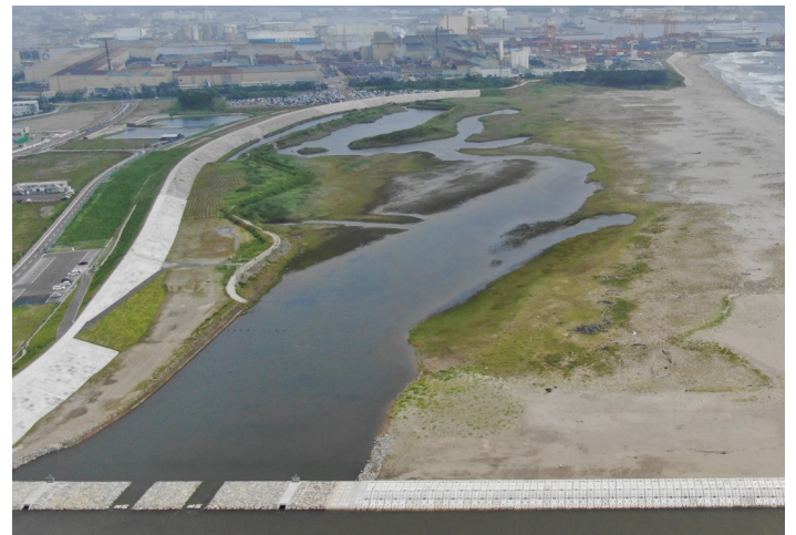
Fig.3 潟湖干潟のようす(ドローン撮影)

調査日時：2021年7月30日（金）9:30～10:30，天気：はれ，満潮時刻 7:05（潮位131cm）