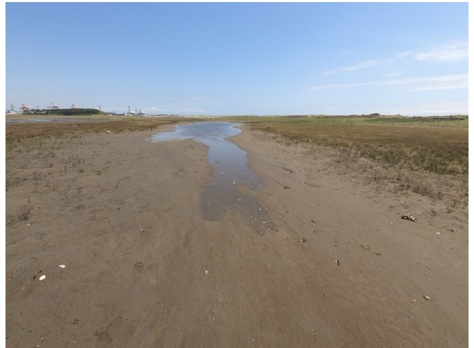
Fig.4 潟湖南東側の様子（南西側から撮影）

調査日 2021年5月13日（木）9:30～11:00 ※干潮時刻10:37（潮位6cm）