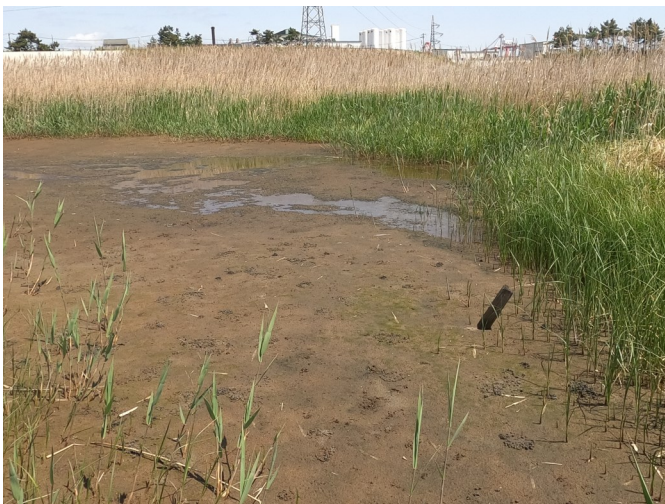
Fig.3 潟湖最北部の様子（南側から撮影）