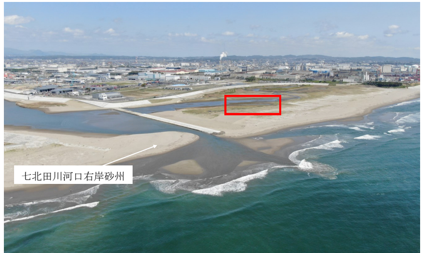
Fig.2 潟湖全体の様子（南東側からドローン撮影）