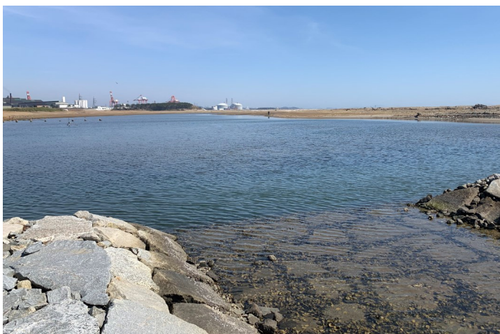
Fig.2 潟湖内の水位が高いようす(導流堤通水部より)