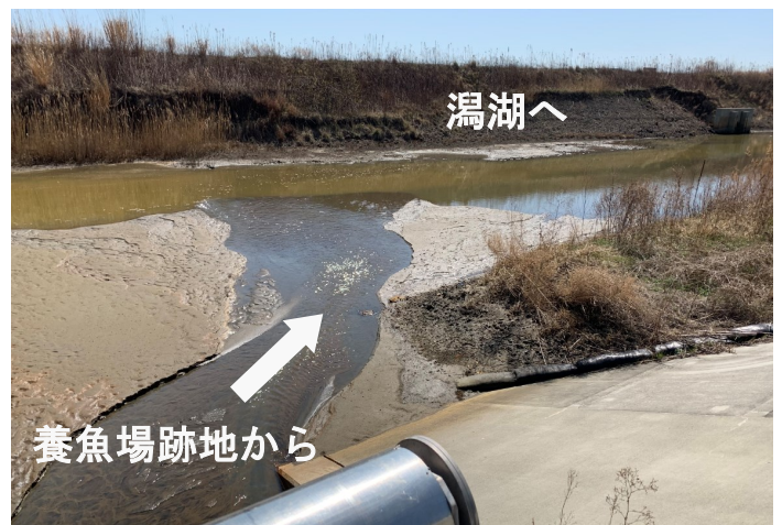
Fig.3 旧養魚所の跡地からの流入のようす

調査日時：2021年3月24日（水）10:00～11:15，天気：晴れ，満潮時刻10:11（潮位105cm）