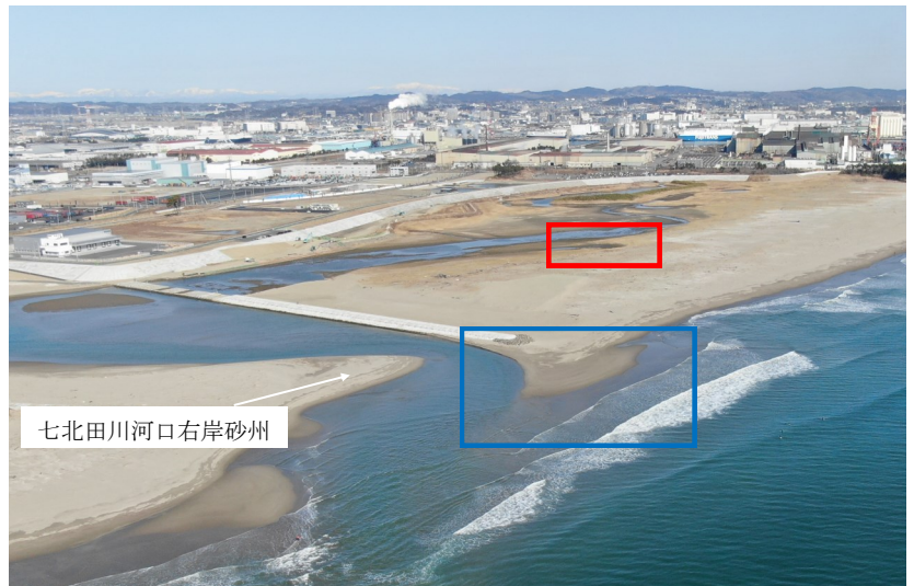
Fig.2 潟湖全体の様子（南東側からドローン撮影）