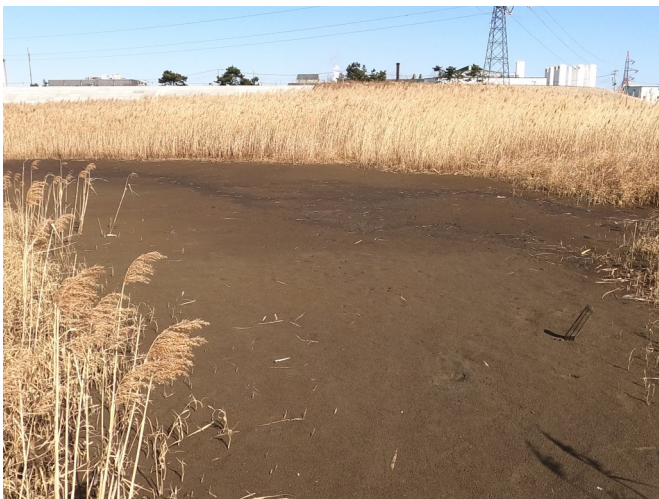
Fig.3 潟湖最北部（南側から撮影）