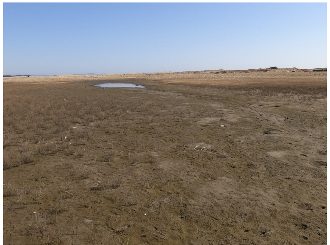
Fig.4 潟湖南東側の分断様子（南西側から撮影）

調査日 2021年2月28日（日）9:30～11:30 ※干潮時刻10:31（潮位58cm）