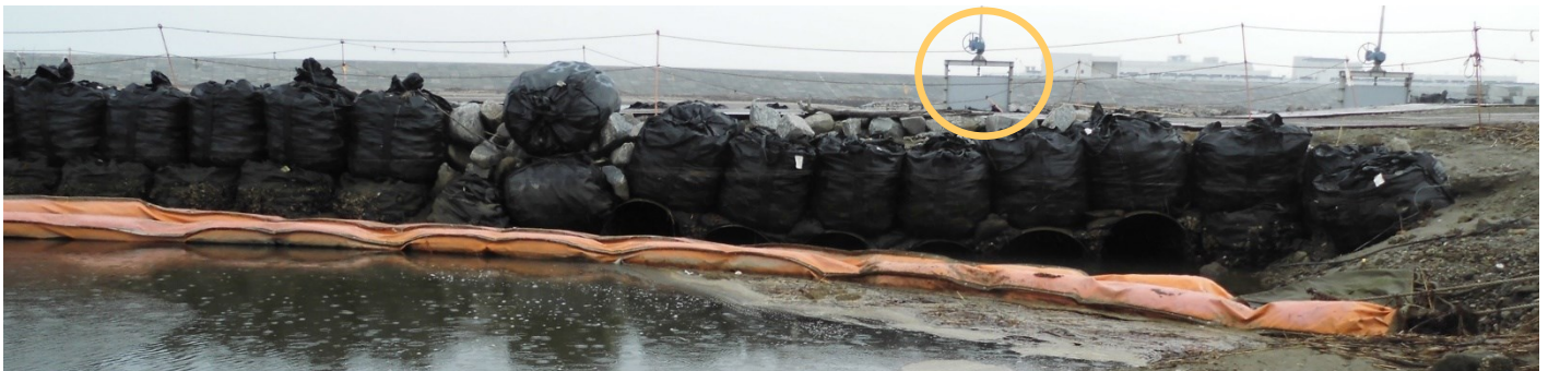
(Fig.1 オイルフェンス 2020. 5.10)

震災前や、津波で導流堤が破壊された後は通水がスムーズで、潟湖内には多くのイシガレイの稚魚が入り込んでいた。七北田川河口には以前海水浴場があり、干潟をわたって海へ行くための橋が設置されていた。現在は橋脚が残るのみであるが (Fig.3) , その付近でも多くのイシガレイが採集された。オイルフェンスが撤去されたことで、水と生物の出入りがスムーズになることは確実であろう。来年は潟湖内でイシガレイを始めとして、多くの生物が確認できることを期待したい。