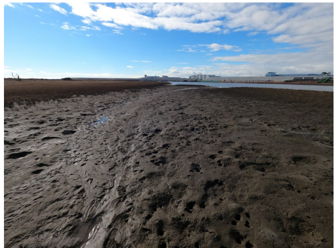
Fig.4 潟湖南東側の分断様子（北東側から撮影）

調査日 2020年12月22日（火）10:30～12:30 ※満潮時刻9:38（潮位120cm）