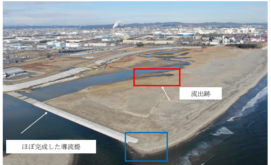
Fig.2 潟湖全体の様子（南東側からドローン撮影）