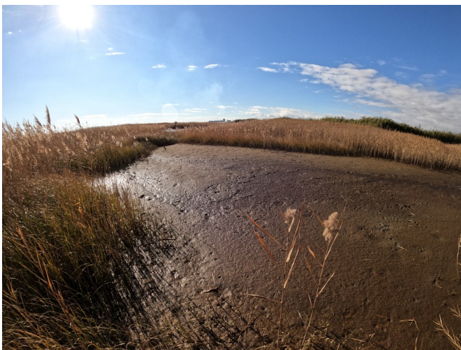
Fig.3 潟湖最北部（北側から撮影）