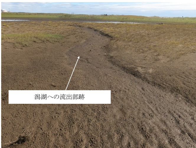
Fig.3 潟湖中央部への流出跡（南側から撮影）