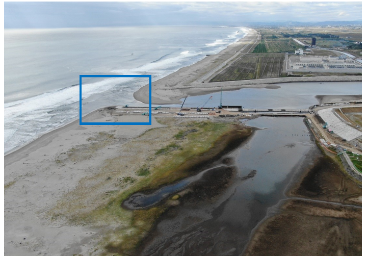
Fig.4 潟湖南側の様子（ドローン撮影）

調査日 2020年10月15日（木）9:30～11:00 ※干潮時刻8:28（潮位38cm）