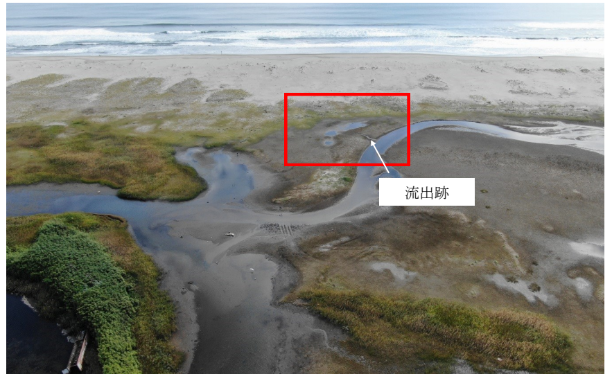
Fig.2 潟湖中央部の様子（ドローン撮影）