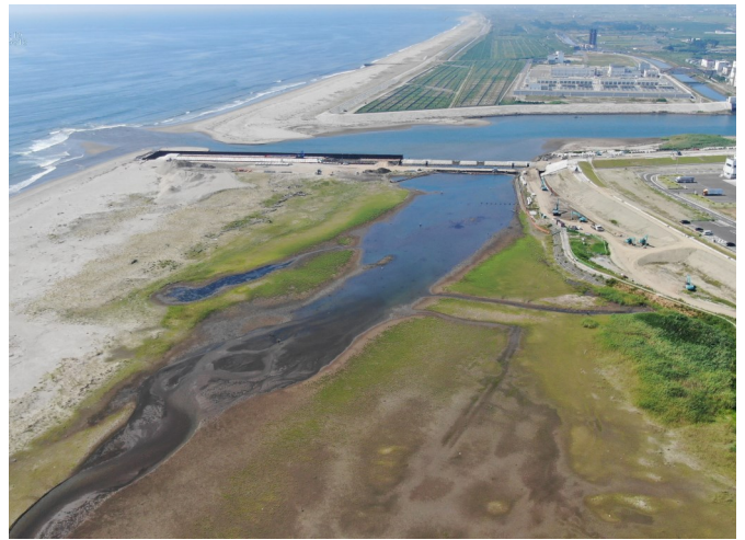
Fig.4 潟湖南側の様子（ドローン撮影）

調査日 2020年8月20日（木）9:30～11:00 ※干潮時刻10:41（潮位15cm）