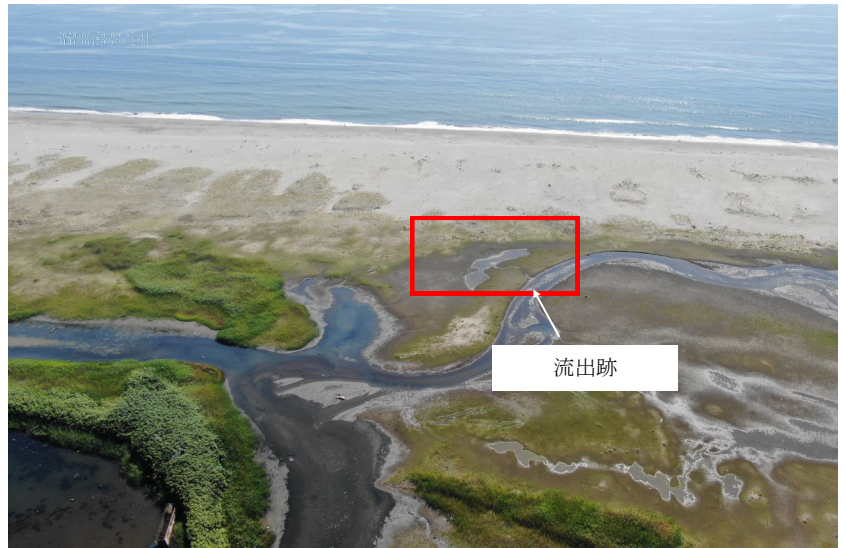
Fig.2 潟湖中央部の様子（ドローン撮影）