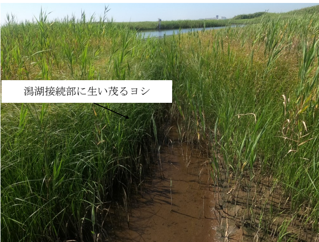
Fig.3 潟湖最北部との接続部（北側から撮影）