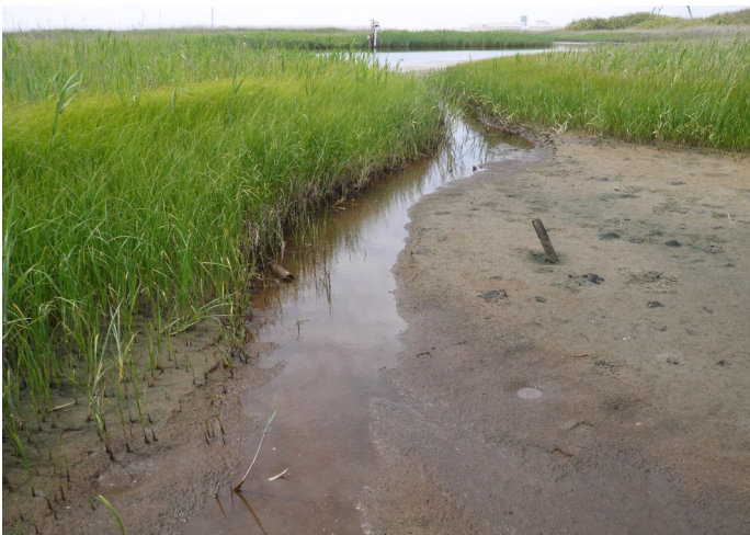
Fig.3 潟湖北側最北部のようす（北側から撮影）