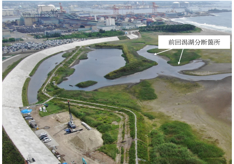
Fig.2 潟湖北側の様子（ドローン撮影）