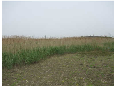
Fig.1 エリアAを南東側から撮影