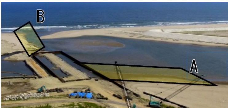
(Fig.1 蒲生干潟・七北田川河口)

潟湖内でも採集を試みたが、採集することはできなかった。Fig.7は通水部であるが、潟湖への入り口が狭く、稚魚が入り込むのは難しいかもしれない。