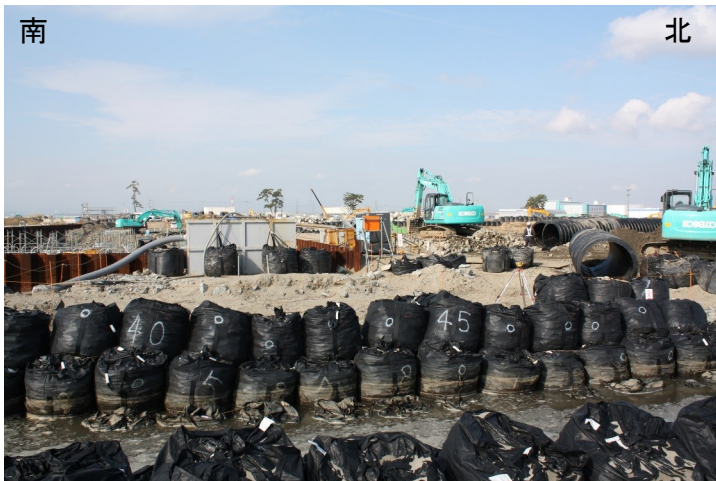
Fig.2 工事中の通水部分(東側より撮影)