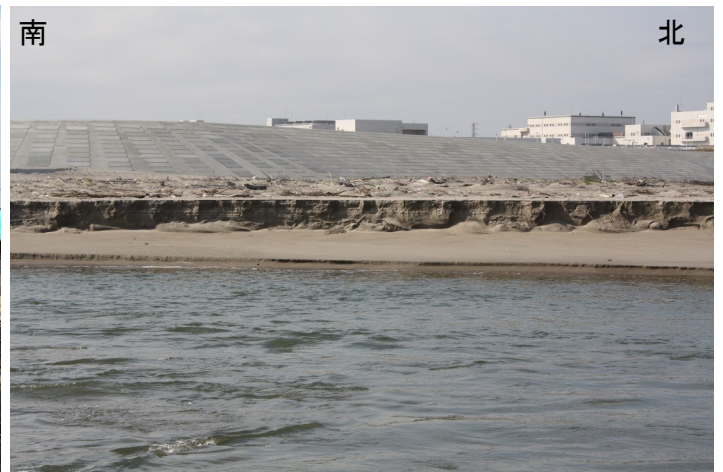
Fig.4 右岸にできた侵食による崖(東側より撮影)

調査日 2018年11月8日(木) 9:40~11:20 ※干潮時刻9:37(潮位75cm)