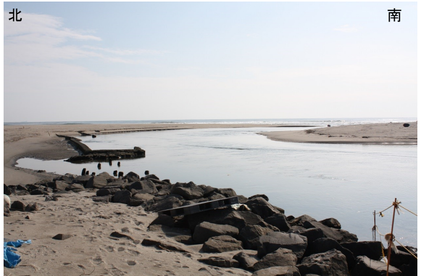
Fig.3 左岸にできた砂州により南に移動した河口(西側より撮影)