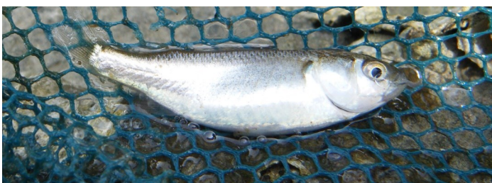
(Fig.3 潟湖内で採集したボラの稚魚)

潟湖内と七北田川の間での生物の出入りがスムーズになったため、潟湖内ではボラの稚魚が多数観察された(Fig.3)。「海のゆりかご」としての干潟の機能がよい方に向かっているとされる。