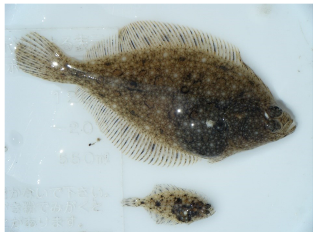
(Fig.2 河口域で採集した最大・最小の個体)