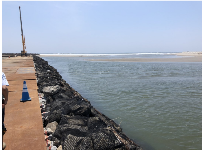
Fig.3 河口付近にできた右岸砂州と左岸砂州(北側より撮影)