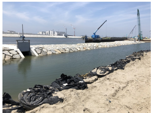
Fig.4 導流堤がほぼ完成している(北側より撮影)

調査日 2019年6月14日(金) 9:30~11:30 ※干潮時刻7:34(潮位40cm)