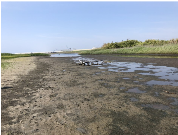
Fig.2 分断が解消した北側潟湖(北側より撮影)