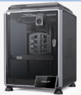
Creality K1C FDM 3Dプリンター